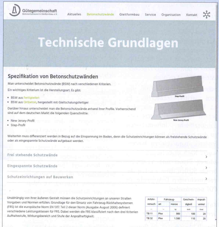
Bild 4: Umfassend werden auf der Webseite auch die Eigenschaften und Wirkungsweise von Schutzeinrichtungen aus Beton beschrieben

sierte Verfahren für die Sanierung von Rissen und die schnelle Reparatur von Ortbeton- und Stahlbetonwänden.