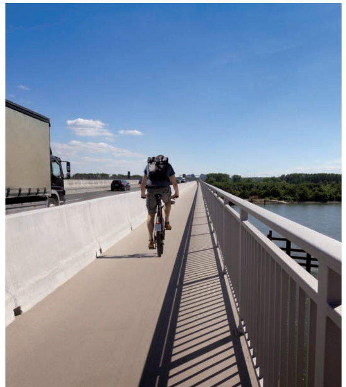
Bild 1: Auf der neuen Schiersteiner Brücke (A 643) über den Rhein schützt die Betonschutzwand LT 104 Radfahrer, Fußgänger und den Schiffsverkehr sicher vor den Kraftfahrzeugen

Ein weiteres Argument war die klare und vollflächige Trennung der Fahrbahnen für Kfz vom Rad- und Fußgängerweg. Gleichzeitig sorgen ausreichend dimensionierte Entwässerungsöffnungen für eine gezielte Durchleitung von Regenwasser. Die Längenausdehnungen der Brücke werden im Fahrzeug-Rückhaltesystem durch Dilatationen vom Typ LT 1-4-1 sicher kompensiert. Auf der Schiersteiner Brücke wurden in jedem LT-104-Strang drei Dilatations-Elemente verbaut.